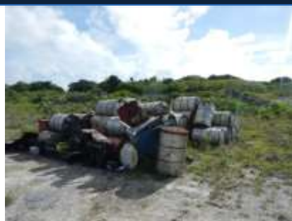
Stock d'huile usagée