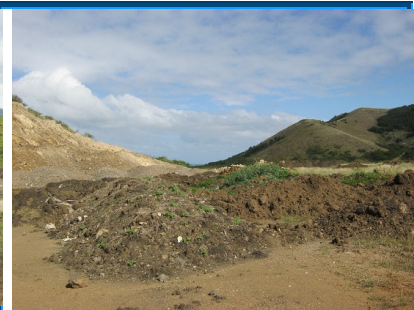
Gestion des déchets inertes