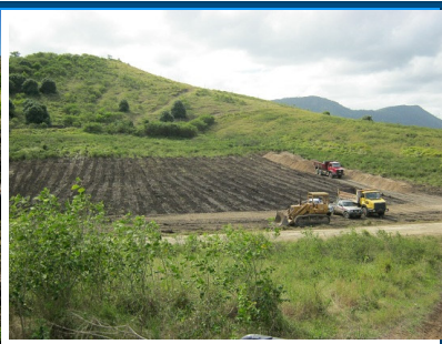
Gestion des déchets inertes